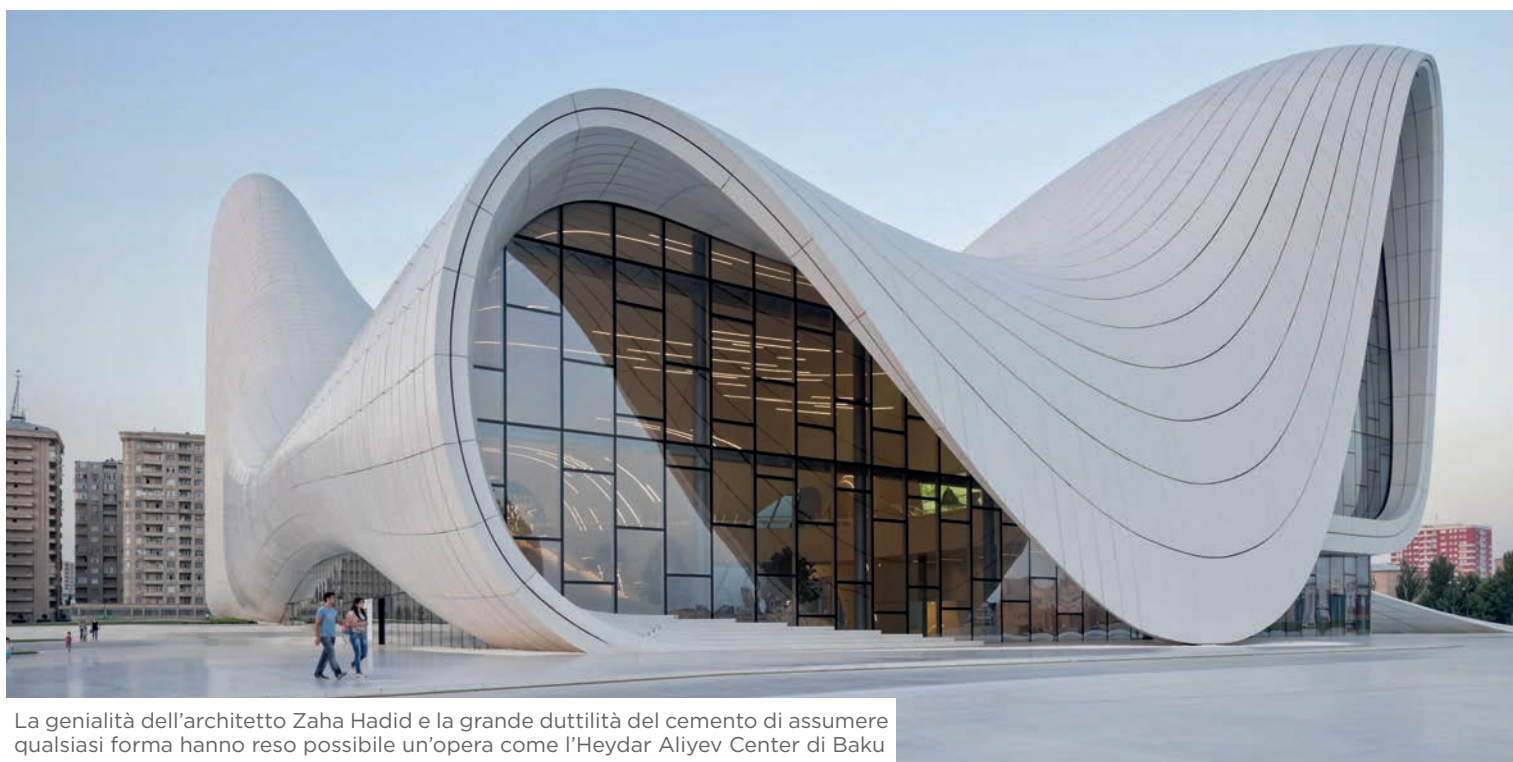
La genialità dell'architetto Zaha Hadid e la grande duttilità del cemento di assumere qualsiasi forma hanno reso possibile un'opera come l'Heydar Aliyev Center di Baku

Il settore cementiero, nell'intento di accrescere la cultura della sostenibilità nell'edilizia, sta lavorando su temi fondamentali come quello dell' economia circolare , della rigenerazione urbana , della messa in sicurezza del territorio , della prevenzione antisismica e dello sviluppo intelligente delle città .